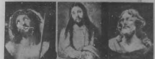
De Guido Reni.—En el Louvre. De Rembrandt.—En el Louvre. De P. Puget.—En Marsella.