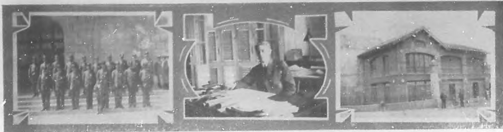
EN LA ESTACION TERMINAL.—Cuerpo especial de policía, creado para el exclusivo servicio en la Estación.—El jefe de tráfico y organizador de la policía especial en su despacho.—Casa-cuartel del Cuerpo de policía especial.

Los conciertos sacros del Plaza.—Dos grandes conciertos se celebrarán los próximos jueves y viernes santo en el salón de Conciertos del Hotel Plaza.