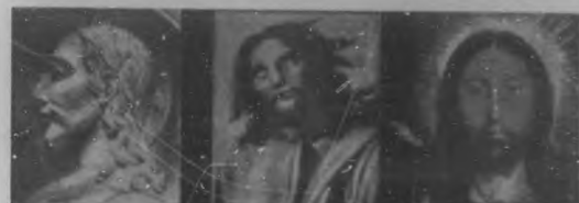
Medallón conservado en Poitiers. De Rafael. En la Transfiguración. De Quintín Masses.—Museo de Amberes.