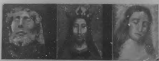
Del museo Beauvais. De Memling, Museo de Amberes. De Leonardo de Vinci, Pincioteca de Brera.

Hechos de la "Biblioteca Oriental" así dice al hablar de Jesús: "Me contó un rabino siciliano, que en su trato se hablaba mucho de la hermosura de aquel que murió crucificado: Las calles de Jerusalén no las andaban otro hijo de mujer más hermoso... Su madre al par de la cruz tenía las mejillas como las flores del Jordán y se hizo moribunda como las margaritas del Cedron... Si tanto cubrió la madre era de ver cómo a aquel su hijo tan grandemente hermoso."