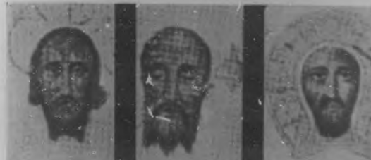
Imagen venerada en San Silvestre, en Roma. "Rostro Santo" conservado en la basílica de San Pedro. Imagen de Jesús, atribuida a San Lucas.