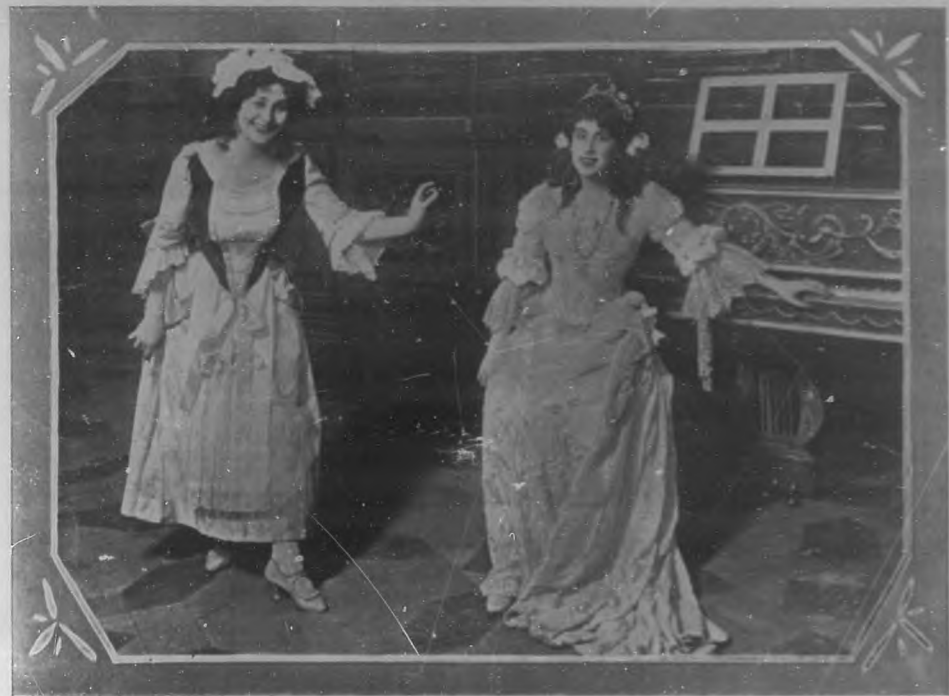
LA OPERA EN EL METROPOLITANO DE NEW-YORK.—Una escena de la ópera "El Amor Médico" estrenada recientemente.

El padre se opone, pero al fin cede, y a falta de otra persona Lisandro consiente en desempeñar el papel de novio en aquel enlace ficticio. Lucinda recobra la salud, y