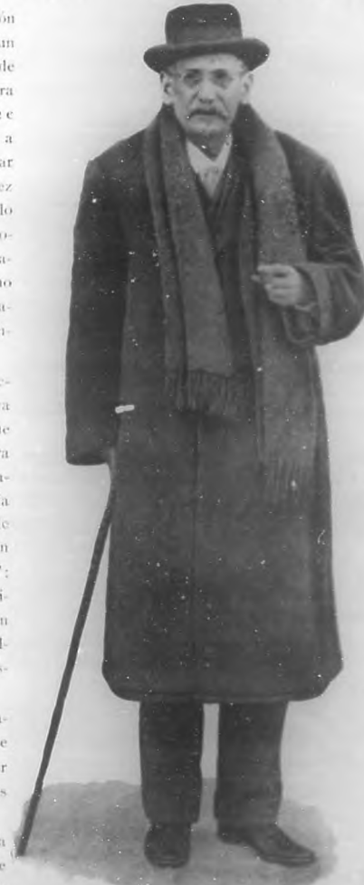
Don Benito Pérez Galdós

Sin inmiscuirnos nosotros en la forma que esta obra haya de llevarse a cabo, ni menos discutir la acción que en ella hayan de tener elementos de gobierno y comisiones designadas; sin analizar tampoco las razones