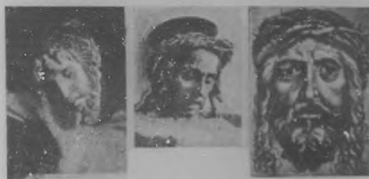
De Benvenuto Cellini.—En el Escorial. Cristo de Montelupo.—Laja. Busto guardado en Amiens.