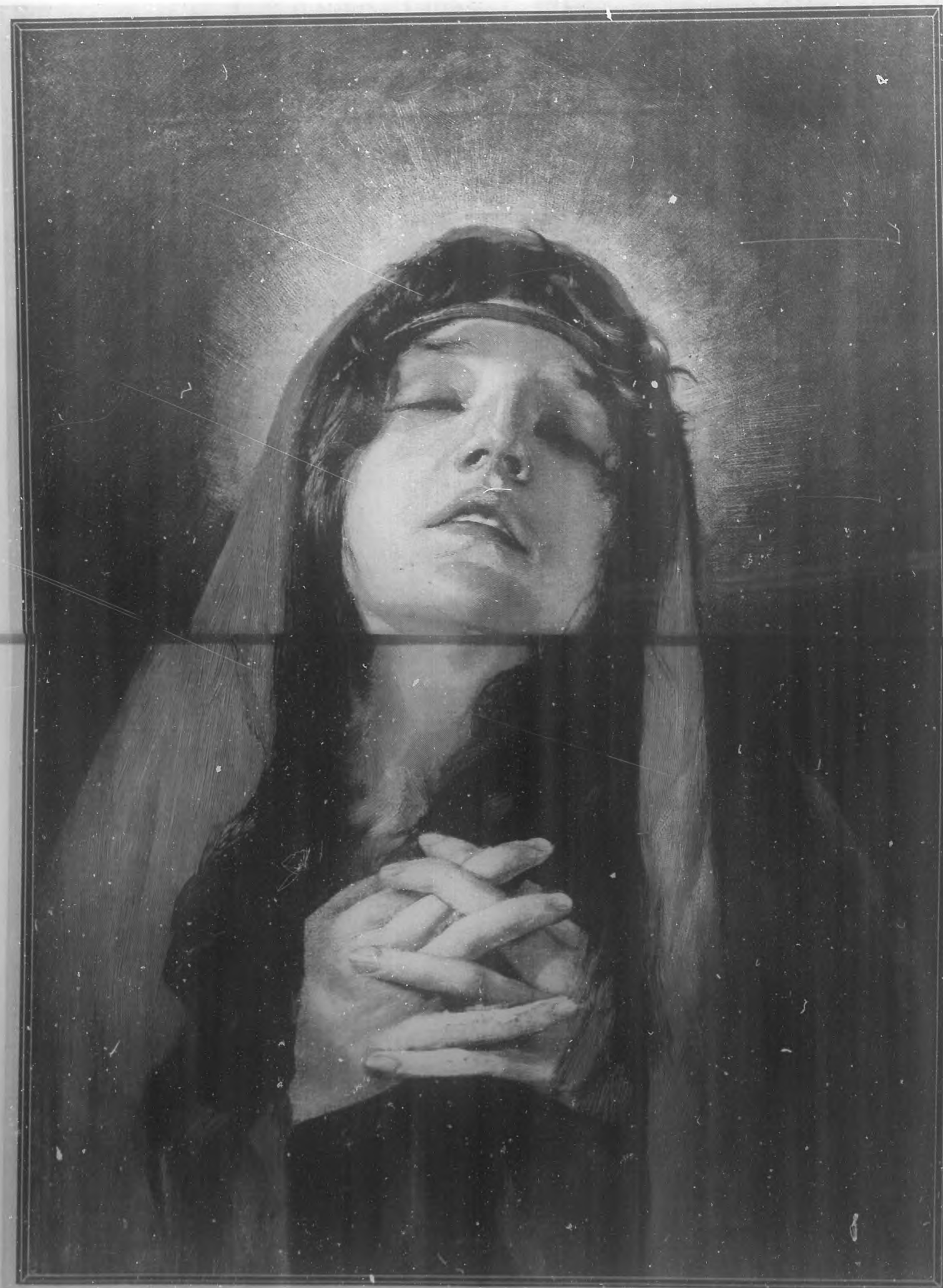
MATER DOLOROSA.— Cuadro de Adolfo Echlér,