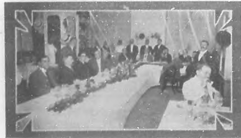
ASOCIACION DE BENEFICENCIA MONTAÑESA.—Presidencia del banquete celebrado el pasado domingo en "El Casino" por los miembros de la nueva directiva de dicha prestigiosa Asociación.

Una obra piadosa.—En nuestra Crónica Social nos ocu-